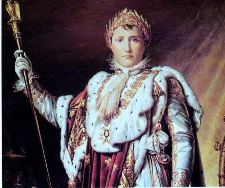
Πίνακας που απεικονίζει τον Ναπολέοντα Α΄ με την στολή του αυτοκράτορα των Γάλλων.

Pour conclure sa conférence, Monsieur Constantinides a souligné que la reconnaissance officielle par la République française de l'origine de Napoléon de l'élément grec de la Corse, donnera encore plus de splendeur à la Révolution française même, au peuple français de l'époque et à la Nation française d'aujourd'hui.